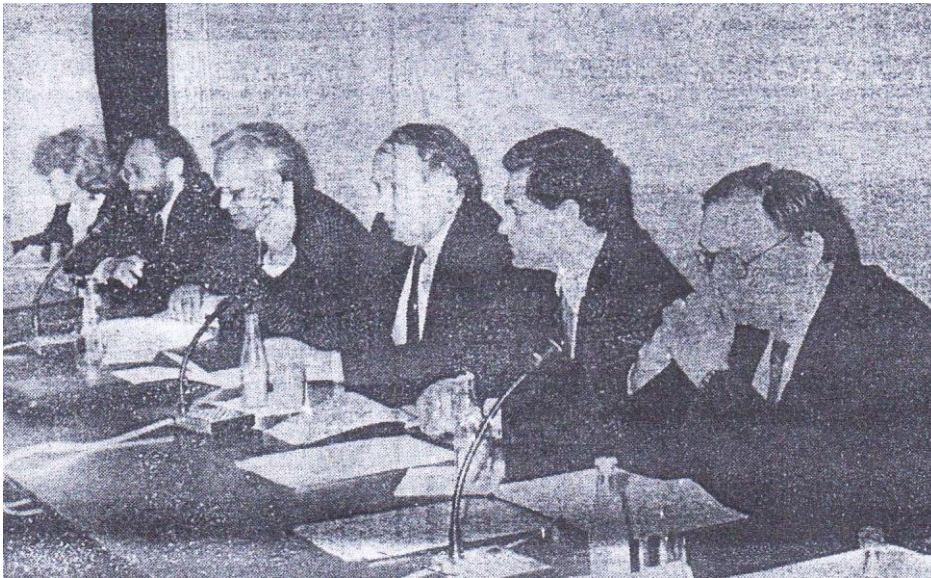
Sa sjednice Odbora za suradnju Sveučilišta sa udruženim radom, 1989. god.

I odabir ne samo istaknutih pojedinaca nego i npr. pojedinih događanja, susreta itd. je mogao biti i dopunjen. Npr., glede velikog priznanja Željezari Sisak za doprinos znanosti i obrazovanju, održan je sastanak Odbora za suradnju Sveučilišta Zagreb sa udruženim radom, 1989. god., ali tog objavljenog priloga nema itd.