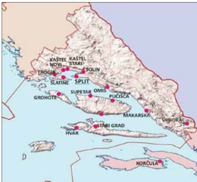
Slika 1. Zastupljenost članova DKST-a po mjestima Splitsko-dalmatinske županije.

Analizirajući i iskazujući brojkama i postocima zastupljenost članova DKST po mjestima Splitsko-dalmatinske županije 2014. godine, zaključujemo sljedeće. Najbrojnije članstvo DKST ima u knjižnicama svog sjedišta – gradu Splitu – 60 članova (72 posto). Potom slijede knjižnice priobalnog područja – na zapad od Solina, Kaštela do Trogira, a na istok od Omiša do Makarske – 13 (16 posto). Unutrašnjost županije ograničena je na samo jednog člana u Vrgorcu (1 posto). Zastupljenost članova na srednjodalmatinskim otocima prisutna je u knjižnicama Šolte, Brača, Hvara i Čiova – ukupno 11 članova (9 posto).